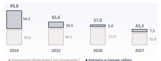
График погашения обязательств Корпоративного центра на 01.01.2024г., млрд. руб.