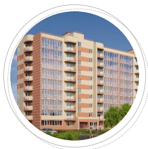
г. Ярославль ул. Летная, л. 5

Застройщик: ООО СЗ «Славянский Дом Бета» Проектировщик: ООО «СлавПроект»