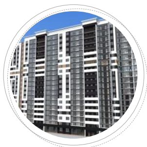
г. Иваново ул. Профсоюзная, д. 4, л. 1

Кол-во квартир: 495 Тип: мон. + кер. кирпич Кол-во этажей: 18, 19