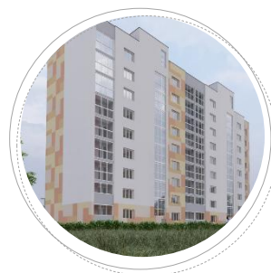
г. Иваново ул. Отдельная л.1

Застройщик: ООО «Славянский дом» г. Ярославль Проектировщик: ООО «СлавПроект»