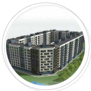
г. Иваново ул. Куконковых

Застройщик: ООО «Славянский Дом» Проектировщик: ООО «СлавПроект»